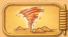
Tempête de sable

À partir de maintenant, quand un joueur gagne une carte et la place devant lui, il commence par regarder si un symbole figure au dos de la carte suivante du paquet :